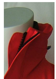
Patte de Protection du Cou

Pour obtenir la fiche technique complète ainsi qu'une offre de prix, contacter f.acca@vps-epi.com