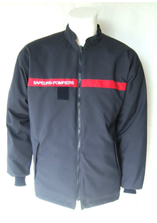
Blouson Marine en Tissu Imper Respirant