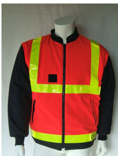
Blouson Haute Visibilité En tissu Imper Respirant Manches Amovibles