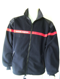
Blouson Marine Polaire Membrane Coupe Vent