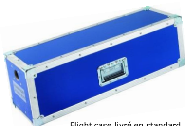
Flight case livré en standard