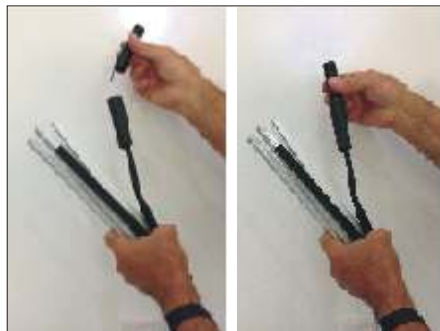
Avec son émetteur et sa batterie intégrés la caméra se positionne en 2 secondes en bout de perche.