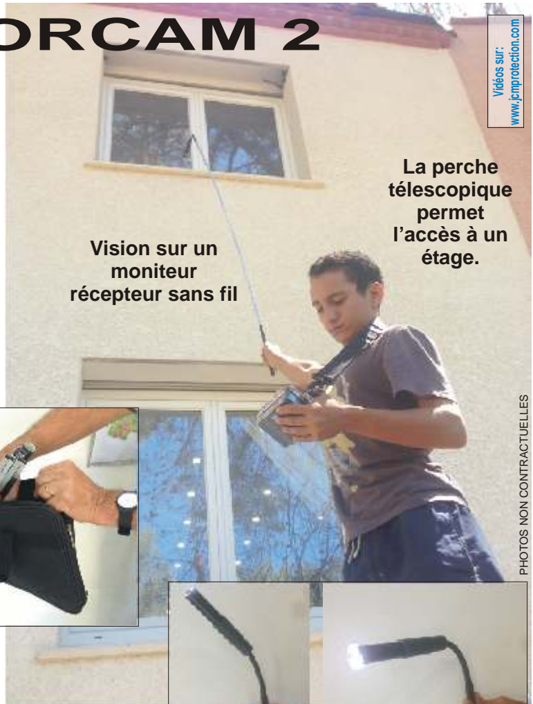
Vision sur un moniteur récepteur sans fil

Les exigences des utilisateurs en matière d'encombrement et de poids nous ont conduits à développer ce nouveau système d'inspection dont l'ergonomie bat des records : 370 Gr pour la perche télescopique de 0,30 à 2 mètres avec sa caméra et 200 gr pour le moniteur-récepteur-enregistreur avec écran 5 pouces !