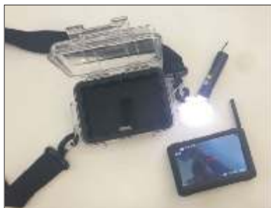
Le moniteur-récepteur-enregistreur peut être visualisé tel quel ou protégé dans un boîtier étanche et anti-choc ou sur un support de poignet (en option).