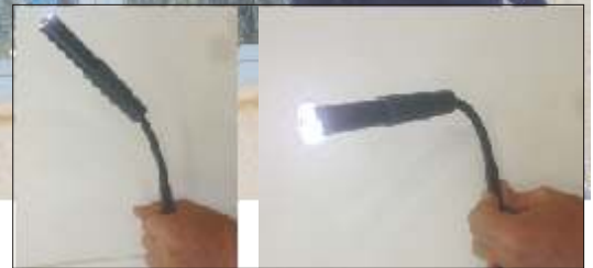
La dernière section qui supporte la caméra est à mémoire de forme pour une pré-orientation avant l'exploration.