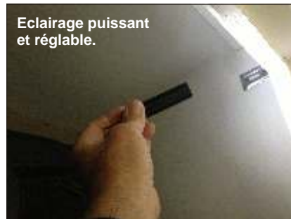
Eclairage puissant et réglable.