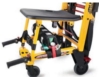
Support pour bouteille d'oxygène