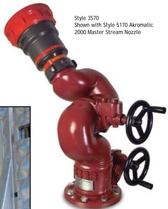
Style 3570 Shown with Style 5170 Akromatic 2000 Master Stream Nozzle