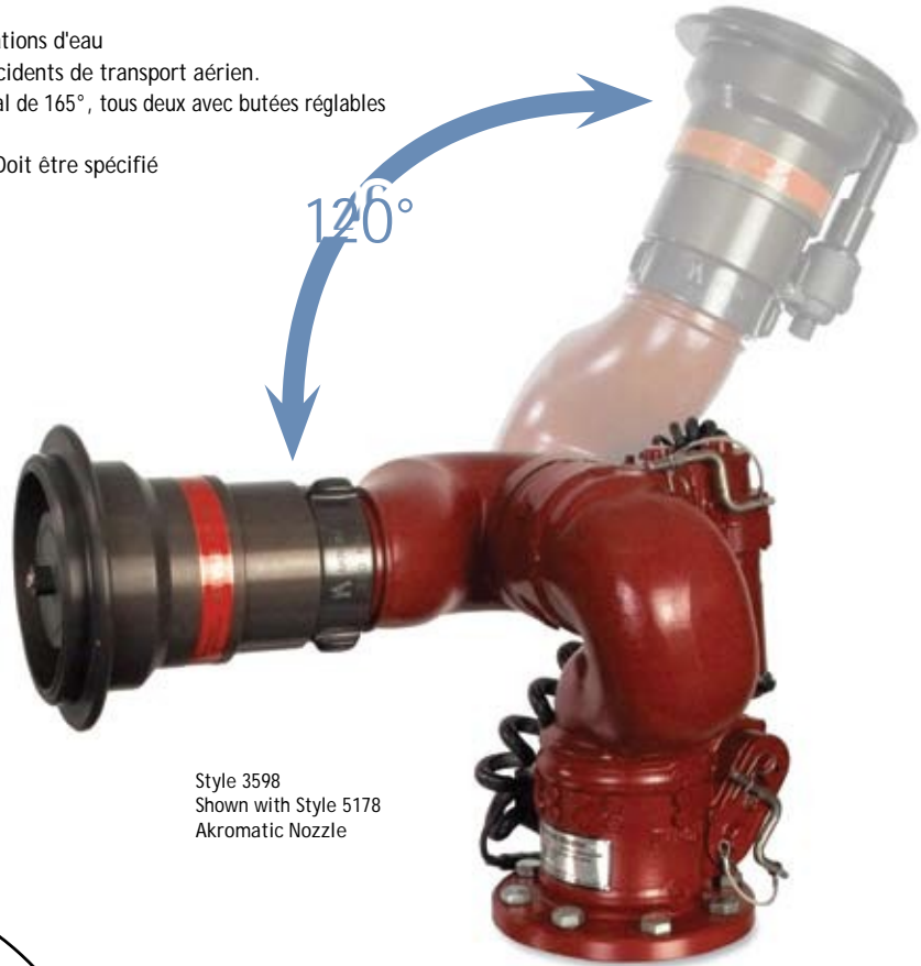
Style 3598 Shown with Style 5178 Akromatic Nozzle