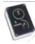
StreamMaster available with position feedback for Position Indicator option