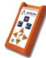
Wireless Remote Control Available