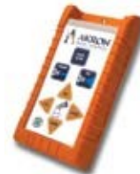
Télécommande sans fil disponible

See Page 45 for Electric Monitor Accessories