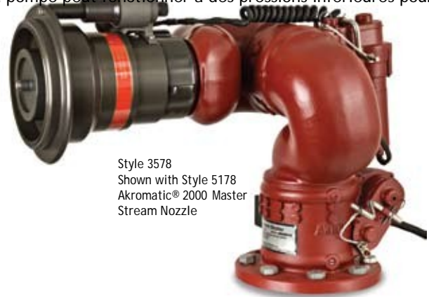
Style 3578 Shown with Style 5178 Akromatic® 2000 Master Stream Nozzle