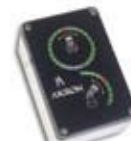
StreamMaster disponible avec retour de position pour l'option Indicateur de position